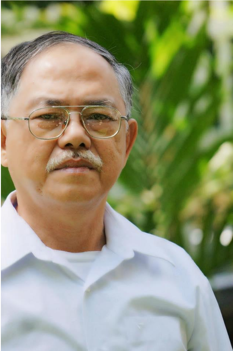
Trần Xuân An – Chiếc cầu Chiến Tranh Lạnh – tập thơ (phần 1 & phần 2)